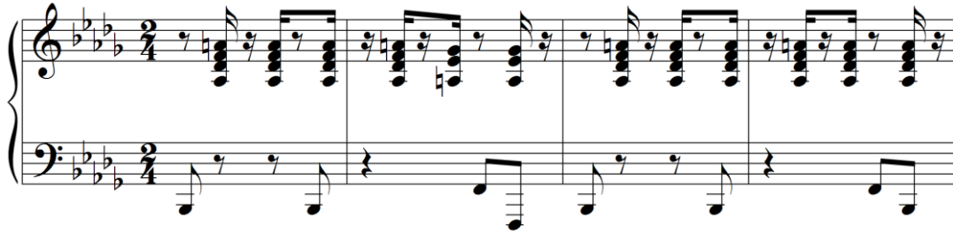
Ex. 9 – Trecho de “Outra Coisa”: Padrão rítmico de acompanhamento (c. 06-09).

Em entrevista, Santos comenta sobre o Mojo e sua invenção, como sempre, de maneira mais poética do que propriamente musical: