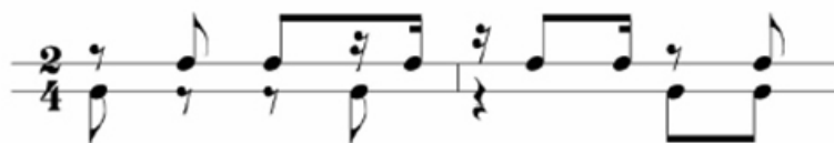
Ex. 10 – Padrão rítmico do Mojo

O Mojo foi utilizado por Santos de muitas formas e com diversos tipos de variações, ou até mesmo adaptações de acordo com a fórmula de compasso 4 . Mas padrão rítmico básico é o seguinte: