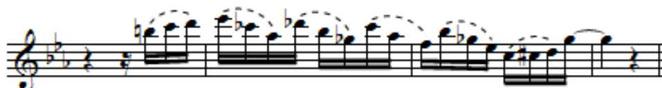
Ex. 3 – Trecho de “De Bahia ao Ceará”: Hemíola (c.09-12).