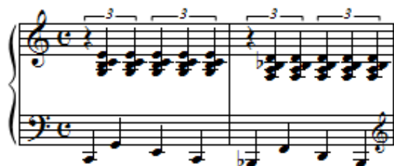
Ex. 6 – Trecho de “Carrossel”: Levada rítmica com subdivisões ternária e binária sobrepostas (c. 1-2).

Como dito no item precedente, o seguinte exemplo está exposto nesse item pois é uma levada rítmica, contudo, também poderia figurar o item anterior pelo fato de também conter uma sobreposição métrica. Ou seja, o acompanhamento rítmico se dá por uma polirritmia de três contra dois. O exemplo é o acompanhamento rítmico das melodias do Ex. 4.