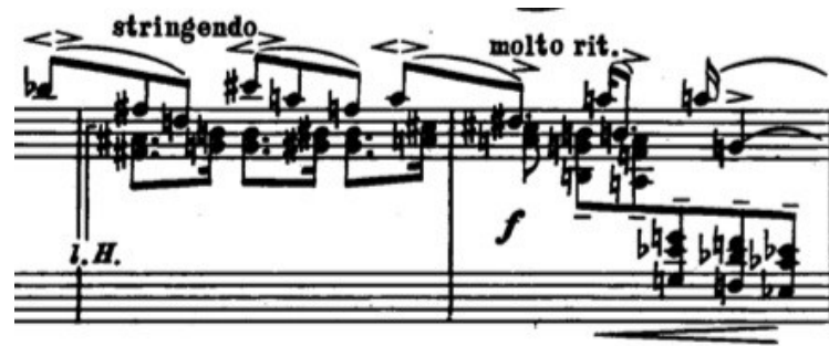
Fig. 4 - Excerto do op. 1 de Alban Berg (Moscow: Muzyka, n.d.(c.a 1970))

Nesse caso, a noção de profundidade estrutural garantida pela relação hierárquica da coexistência de sistemas tonais passa a não ter mais validade. Segundo a definição de função linear como "a relação do evento com o enquadramento ou base linear estrutural" (Berry,1976), entendemos aqui o evento em uma relação com as camadas mais superficiais de uma possível análise reducionista, já que, não havendo uma disposição de profundidade estrutural-tonal, a "relação auxiliar com um evento de ordem maior" (Idem, Ibidem) se torna menos evidente. A função linear, nesse caso, tem como evento de ordem maior o princípio de traços, arcos e direcionamentos, e não as disposições harmônicas embasadas nos preceitos do tonalismo. Dessa forma, é abordada na prática composicional a proposta de uma composição de gestualidades e figurações que dialogam de modo mais independente (ou totalmente independente) com a disposição hierárquico-tonal. Tal proposta sugere uma diferente concepção da noção de espaço e textura musical na prática composicional. 7