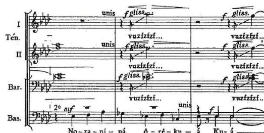
Fig. 15: Tema A com glissandos

A quarta seção, por sua vez, retoma o Tema A, transposto uma quinta abaixo e com algumas notas modificadas, dessa vez cantado apenas pelos baixos, enquanto que barítonos e tenores, do compasso 100 ao 104, executam glissandos com sons onomatopaicos (vuzfzfz) (Fig. 15).