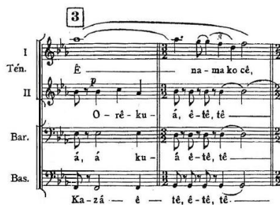
Fig. 3: Justaposição de camadas

Salles nos mostra esse mesmo procedimento na peça A baratinha de papel, da Prole do Bebê nº 2 quando fala de camadas autônomas no capítulo referente à textura na sua tese de doutorado (SALLES, 2005, p. 87).