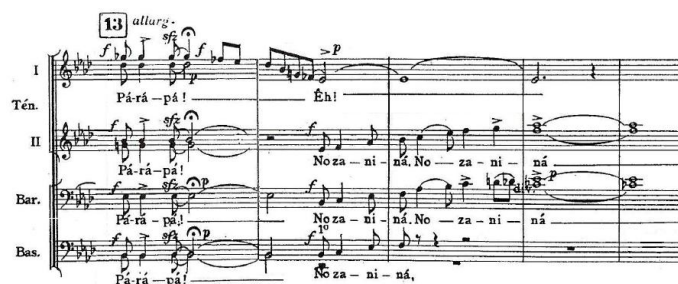
Fig. 14: Transição para a seção D

A partir do compasso 96 inicia-se uma transição que leva para a seção D, utilizando intervalos de quarta que depois viram terças, com uma figuração rítmica parecida à da transição para a seção C (Fig. 14).